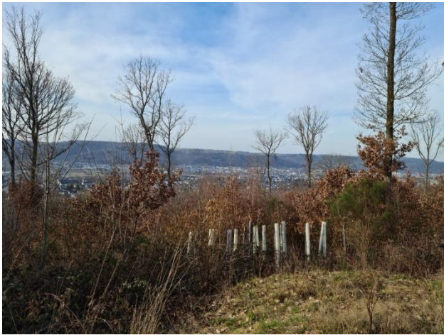
5: Blick auf Trier