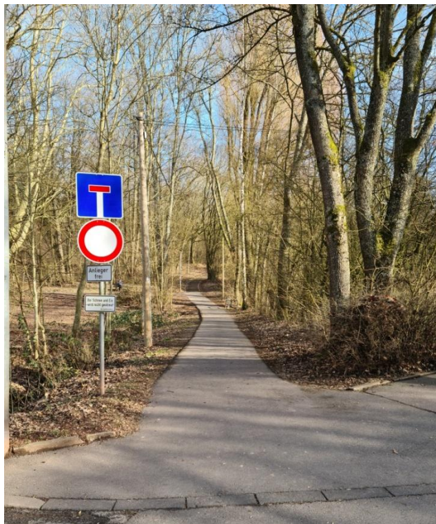
2: hier hinauf zum Mariahof