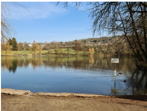
1: Mattheiser Weiher

Nach Überqueren der Straße setzen wir die Wanderung auf dem naturbelassenen Weg fort (Foto 9). Auch auf diesem Weg bleiben wir für eine längere Strecke, auf der rechten Seite erkennen wir eine Mulde, an deren Ende (Foto 10) wir uns rechts halten und dann auf der anderen Seite der Mulde hinunter zur Mosel (Foto 11) gehen. Diese erreichen wir auf Höhe des Estricher Hofes und nutzen die hier vorhandene Unterführung um auf den Moselradweg zu gelangen (Foto 12). Auf dem Radweg – empfehlenswert ist der untere Weg - laufen wir rechts bis zur Höhe der Hohenzollernstr und gelangen über diese Straße zurück zum Ausgangspunkt unserer Wanderung.