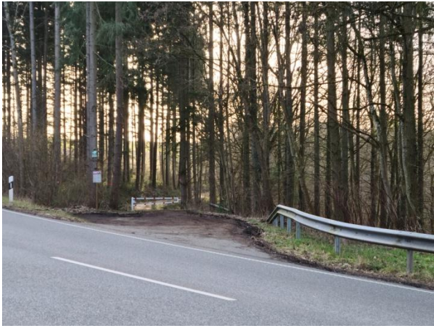
9: Fortsetzung der Route an der B268