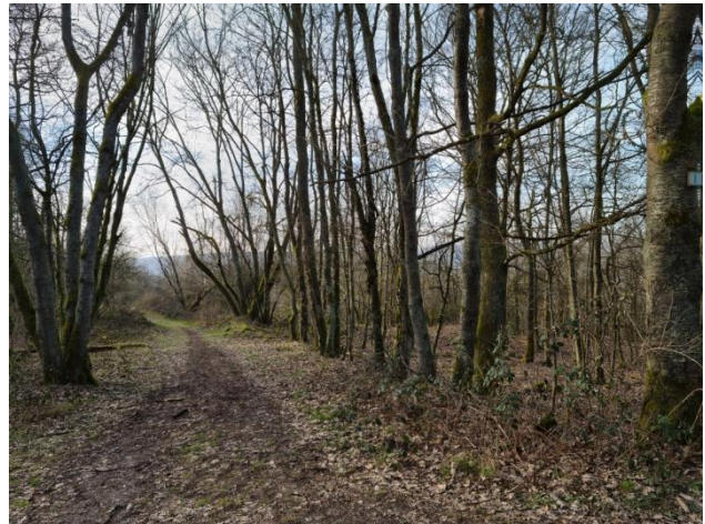
6: Abstecher zum Aussichtspunkt