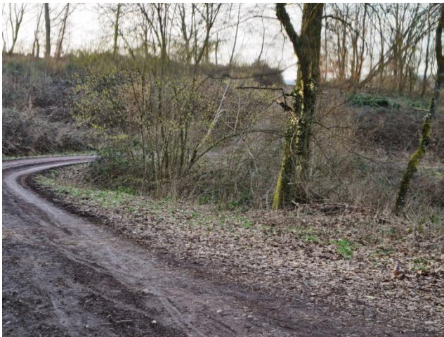
11: Auf dem Weg hinunter zur Mosel