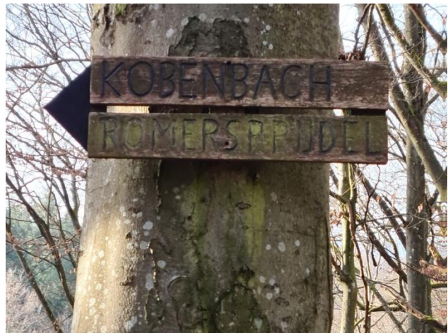
8: Wegweiser zu Kobenbach, Römersprudel