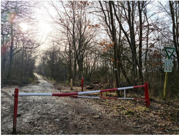
3: Mariahofer Rundwanderweg I