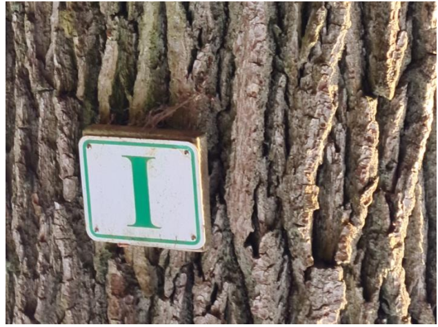
4: Markierung des Mariahofer Rundwanderweges I