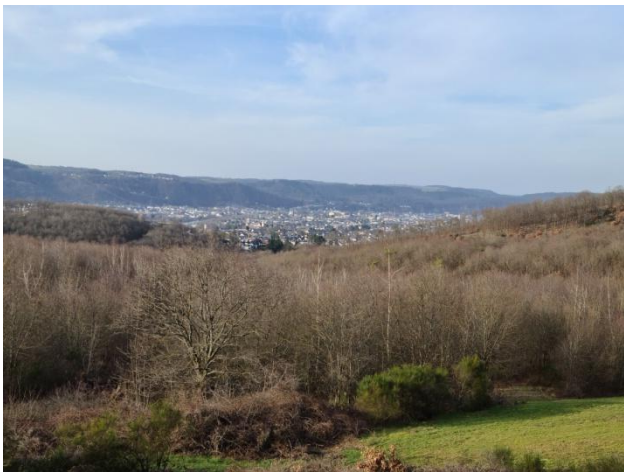
7: Blick Ins Moseltal mit Trier