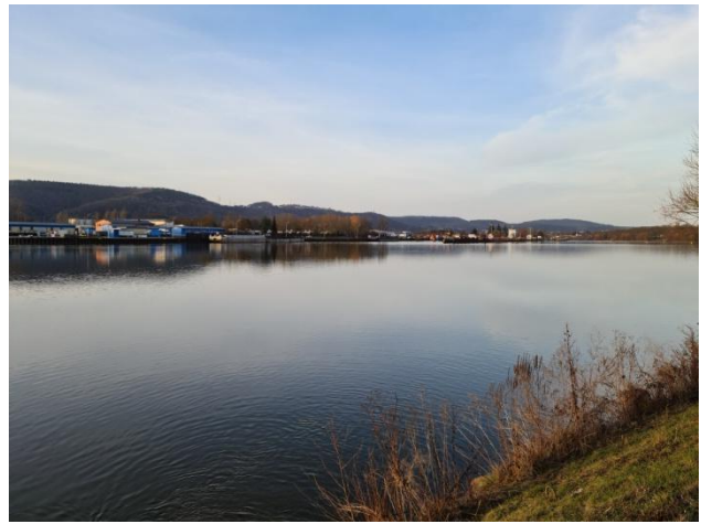
12: Mosel in Höhe Estricher Hof