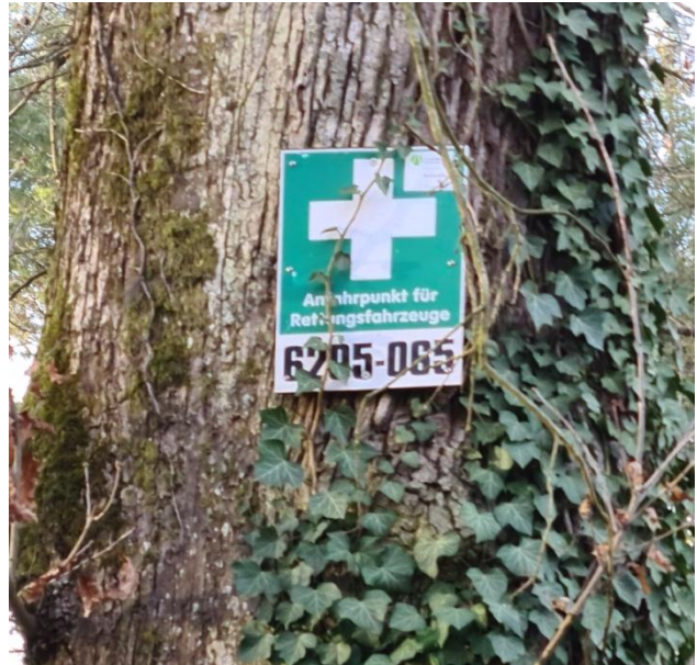
10: hier rechts halten